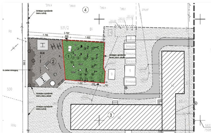
▲ Stara Słupia