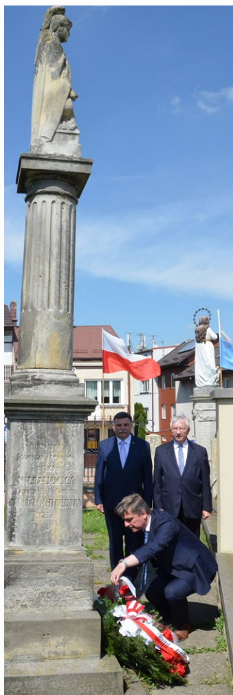
Parlamentarzyści złożyli pod figurą św. Floriana okolicznościowy wieniec