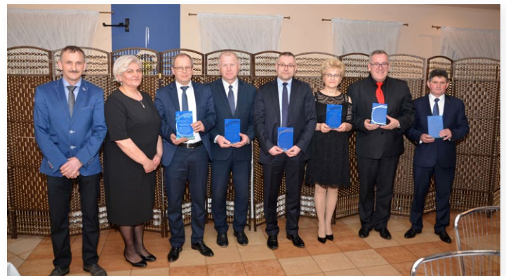
▲ Grupa Emeryk dziękowała władzom samorządowym za wsparcie ich działalności