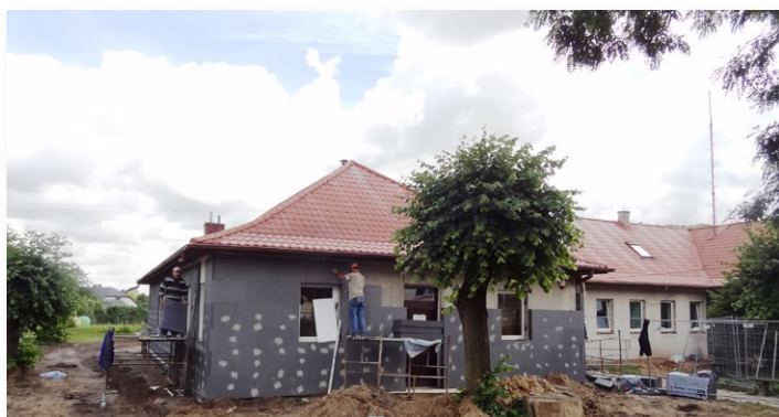
▲ Budynek ośrodka zdrowia w Rudkach doczekał się gruntownego remontu

Aktualnie realizowane projekty termomodernizacyjne na terenie gminy Nowa Słupia to efekt podpisanych umów: