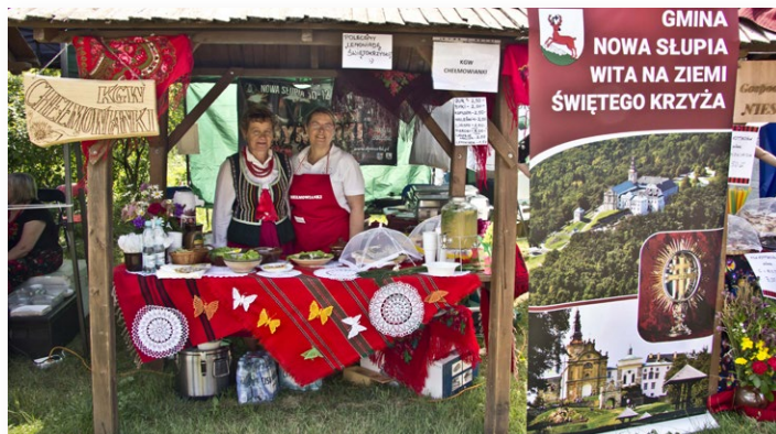
▲ Wyróżnione stoisko Chełmowianek

W dniu 3 czerwca 2018 w Muzeum Wsi Kieleckiej w Tokarni odbył się XIII Jarmark Agroturystyczny. Podczas imprezy został przeprowadzony konkurs kulinarny pod nazwą „Ziółka i zioła ze świętokrzyskiego siola” w kategorii Powiat Kielecki. Do konkursu zgłosiło się 35 podmiotów. Gminę Nowa Słupia reprezentowało Koło Gospodyń Wiejskich „Chełmowianki”, które w konkursie na najładniejsze stoisko KGW otrzymało pierwsze wyróżnienie.