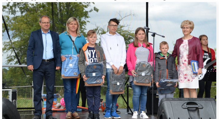
▲ Za udział w konkursie plastycznym organizowanym przez GKRPA uczniowie otrzymali cenne nagrody