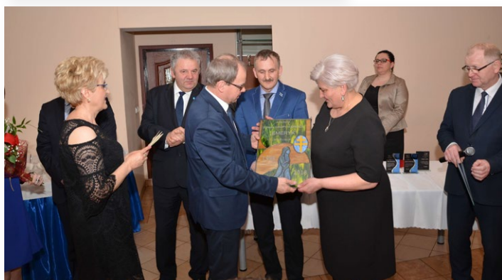
▲ Wójt Gminy przekazał Stowarzyszeniu przepiękny pamiątkowy witraz