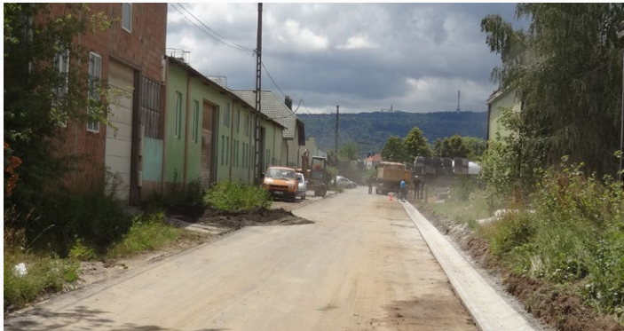
Przebudowa drogi w Rudkach ul. Zakładowa

Obecnie na terenie gminy trwają zaawansowane roboty drogowe.