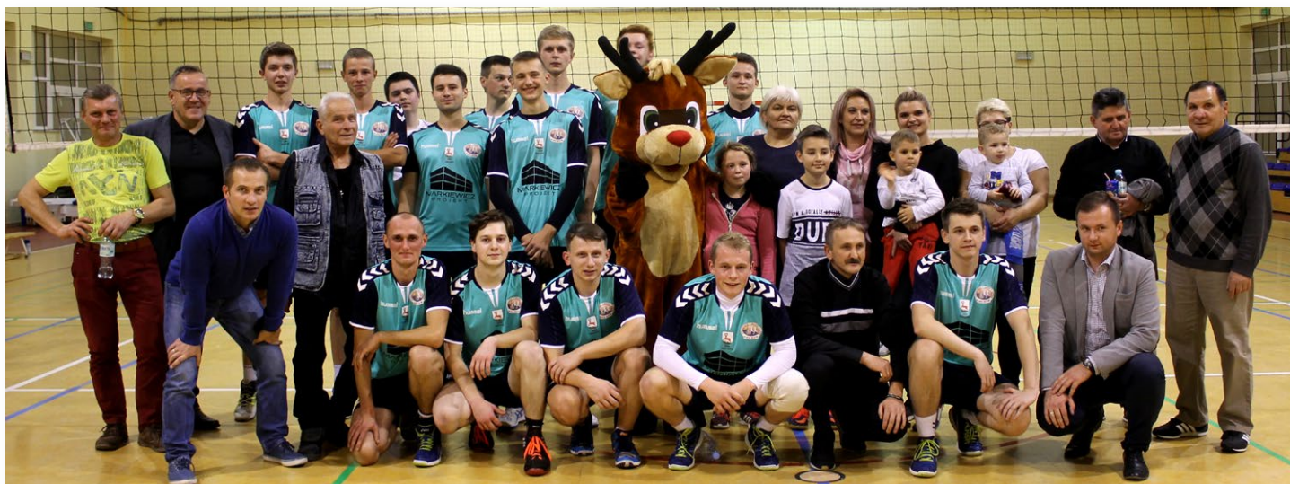
▲ Zajęcie 3.miejsca w debiucie to ogromny sukces drużyny