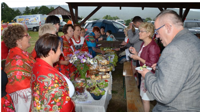
▲ Panie z kół gospodyń wiejskich doskonale spisały się w konkursie kulinarnym

Moc atrakcji czekająca na uczestników festynu sprawiła że nawet intensywny deszcz, który zaczął padać z chmur na baszowickim nie był w stanie zniechęcić mieszkańców gminy do udziału we wspólnej zabawie, którą zakończył spektakl świętojański i tradycyjne puszczanie wianków. O dobrą zabawę od samego początku zadbał zespół Krokus.