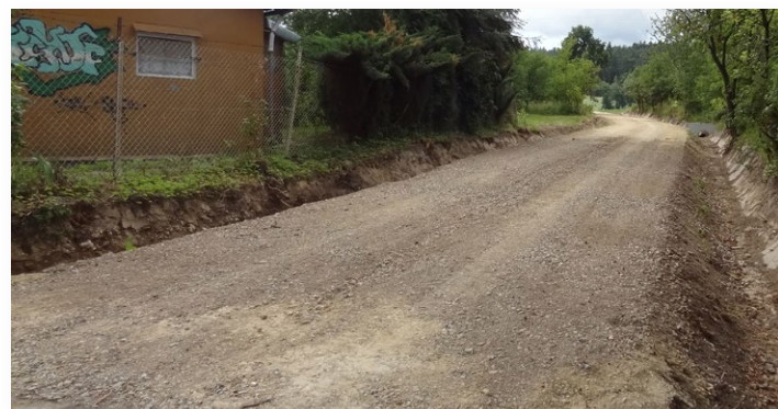
Remont drogi w Dębniaku