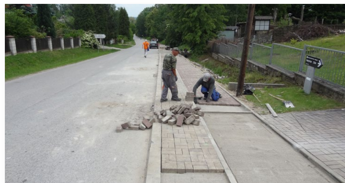
Remont chodnika w Nowej Słupi

W Nowej Słupi przy ulicy Świętokrzyskiej w pasie drogowym została naprawiona nawierzchnia chodnika. Wymienione zostały zapadnięte elementy kostki brukowej oraz obrzeża. Chodnik zyska też nową funkcjonalność w postaci dodatkowego pasa dla osób niepełnosprawnych z wózkami czy też użytkowników mających problemy przy pokonywaniu schodów terenowych.