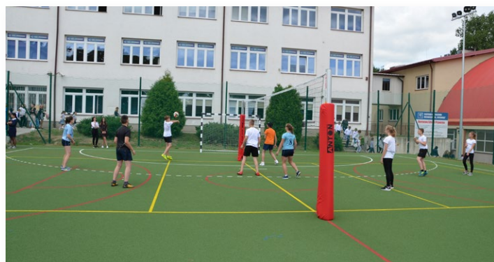
Na nowym boisku rozegrano pierwszy mecz pokazowy