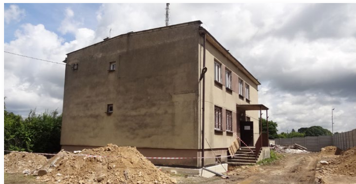
▲ Gruntowną termomodernizację przejdzie również budynek po byłym posterunku policji z przeznaczeniem na GOPS, Ref. Ochrony Środowiska, Zespół Obsługi Szkół

cji, w których największy udział mają zazwyczaj wydatki związane z ogrzewaniem budynków.