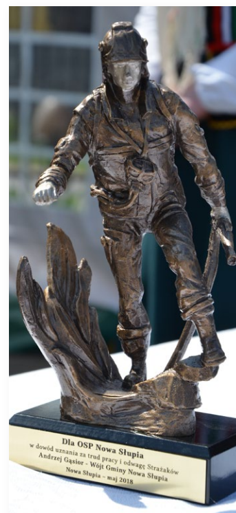
Po uroczystości wszyscy udali się na wspólny obiad.

Wszyscy dziękowali strażakom za ofiarną służbę i życzyli bezpiecznych powrotów z akcji oraz wszelkiej pomocy.