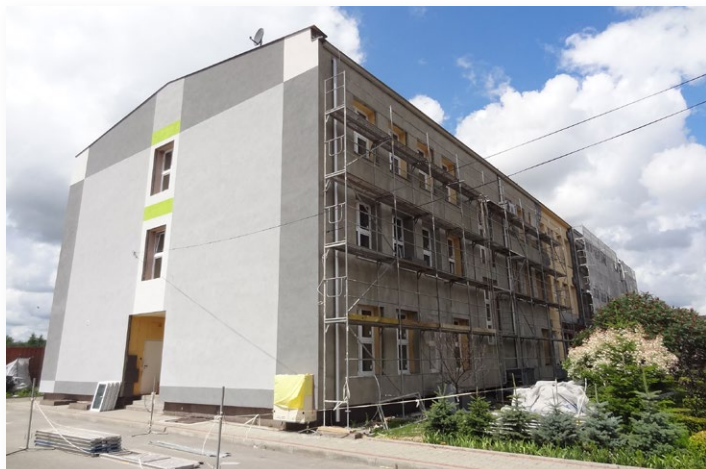
▲ Szkoła w Rudkach pięknieje. Nowa ocieplona elewacja, okna, instalacja gazowa, fotowoltaika ma zapewnić nie tylko ciepło ale również oszczędności

O maja do czerwca 2018 r. Wójt Gminy Nowa Słupia podpisywał umowy z wykonawcami na realizację termomodernizacji budynków użyteczności publicznej.