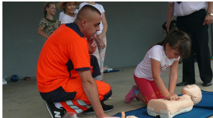
▲ Pokaz ratownictwa medycznego dla najmłodszych

Na uczestników zabaw czekały nagrody. Do dyspozycji małych uczestników były też darmowa dmuchana zjeżdżalnia, czy basen z kulkami, a także stoisko z watą cukrową i smacznymi przekąskami.