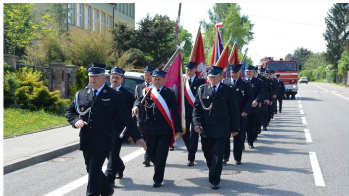
Uroczystości rozpoczął przemarsz jednostek OSP