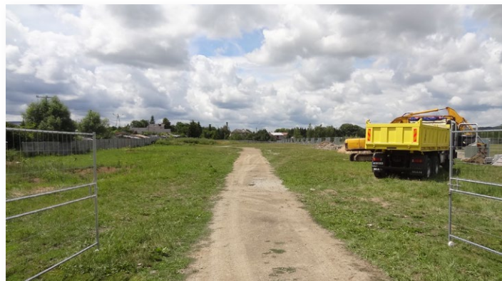
▲ Plac pod przebudowę Targowiska w Rudkach

W związku z prowadzonymi pracami mogą wystąpić pewne przejściowe utrudnienia, za które z góry przepraszamy. Mamy nadzieję, że poprawa jakości targowiska wy-