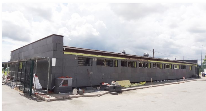
▲ Roboty ociepleniowe na budynku GKS w Rudkach