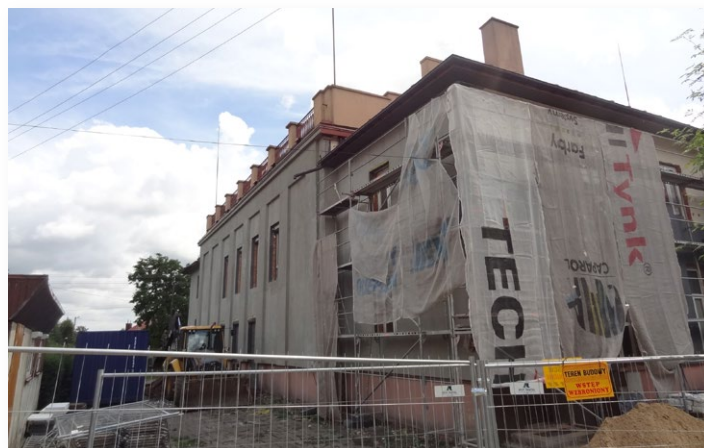
▲ Po termomodernizacji GOK w Rudkach zyska nowe oblicze

Termomodernizacja to przedsięwzięcie prowadzące przede wszystkim do poprawy efektywności energetycznej obiektów, przy równoczesnym zmniejszeniu kosztów ich eksploata-