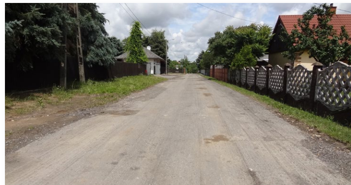
Remont drogi w Rudkach Os. Górne