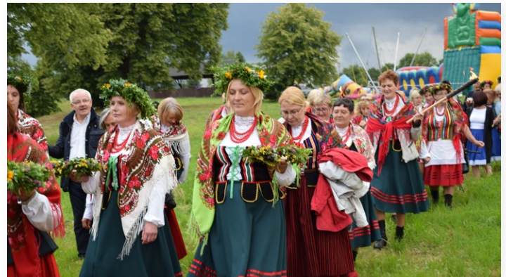
▲ Barwny korowód z wiankami ..

Strażacy uczyli dzieci i młodzież jak prawidłowo przeprowadzić akcję reanimacyjną (resuscytację krążeniowo-oddechową), a dzieci które znały numery alarmowe schodziły ze sceny z nagrodami. Ale nagrody czekały nie tylko na najmłodszych. Dla działających na terenie gminy Kół Gospodyń Wiejskich zorganizowano konkurs pod hasłem „Sałatki, sałateczki, sałatunie”. Jury nie mieli łatwego zadania, bowiem każda grupa przygotowała potrawy na