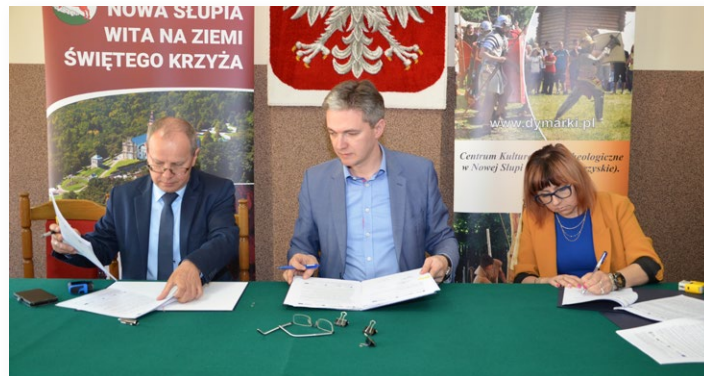
▲ Gmina Nowa Słupia jest wśród liderów pozyskiwania środków z Unii Europejskiej