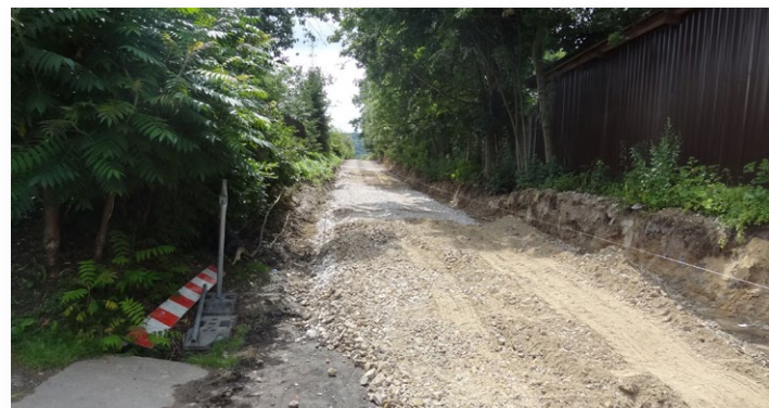
Remont drogi Dębno Zagacki - Jezioro