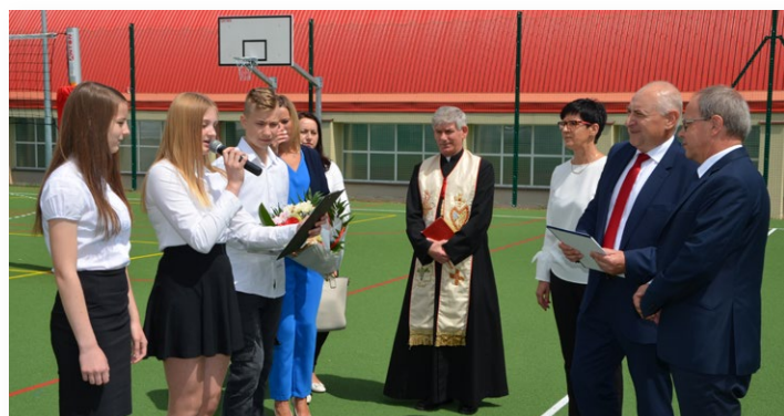
Były również podziękowania od młodzieży szkolnej