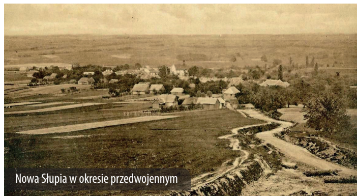
Nowa Słupia w okresie przedwojennym