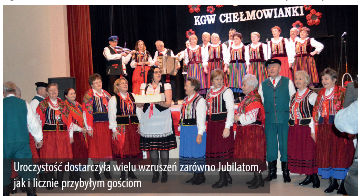
Uroczystość dostarczyła wielu wzruszeń zarówno Jubilatkom, jak i licznie przybyłym gościom

Po części artystycznej uczestnicy uroczystości zostali zaproszeni na kawałek urodzinowego tortu.