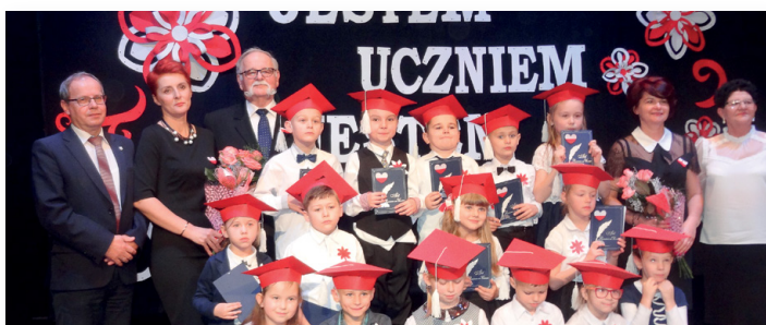
▲ Niezwykle efektownie ślubowały pierwszaki z Rudek