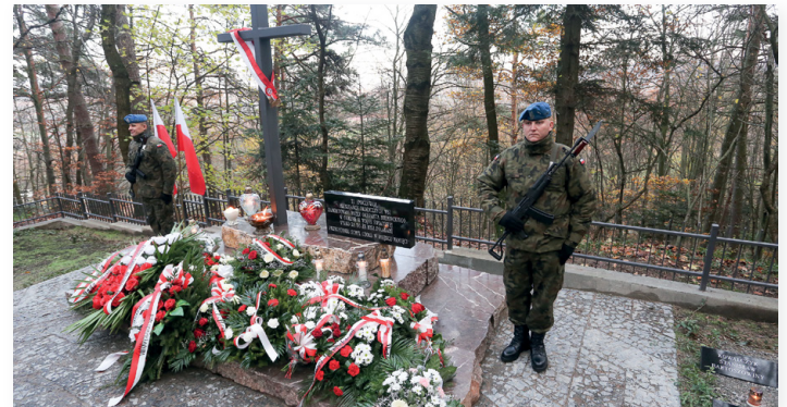
▲ Honorowa asysta żołnierzy z Centrum Przygotowań Misji Zagranicznych w Kielcach

Odczytany został Apel Pamięci, a żołnierze Wojskowej Asysty Honorowej z Centrum Przygotowań do Misji Zagranicznych w Kielcach oddali salwę honorową. Przy pomniku zgromadzeni przedstawiciele władz gminnych, powiatowych i wojewódzkich, parlamentarzyści, przedstawiciele Świętokrzyskiego Parku Narodowego, uczniowie, harcerze, a także mieszkańcy i rodziny złożyli wieńce oraz zapalili wieńce. Na zakończenie odegrany został sygnał „Śpij Kolego”.