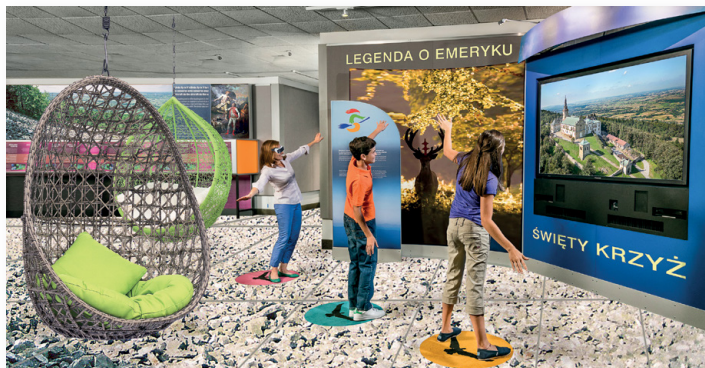
▲ Wizualizacja Parku Dziedzictwa Gór Świętokrzyskich „Łysa Góra”

Park Dziedzictwa Gór Świętokrzyskich w Nowej Słupi otrzymał dofinansowanie z Unii Europejskiej. To wynik rozstrzygnięcia konkursu z Regionalnego Programu Operacyjnego Województwa Świętokrzyskiego na lata 2014-2020. Ogłoszony przez Urząd Marszałkowski konkurs z działania „Zachowanie dziedzictwa kulturowego i naturalnego” realizowany był dla Obszaru Strategicznej Interwencji – Obszaru Gór Świętokrzyskich.