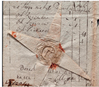
▲ Pieczęć miasta Słupia Nowa