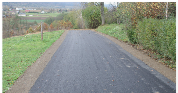
▲ A tak wygląda nowy dywanik asfaltowy w Starej Słupi