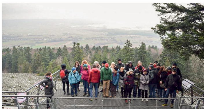
▲ Uczestnicy konferencji odbyli tournée po województwie poznając największe jego atrakcje