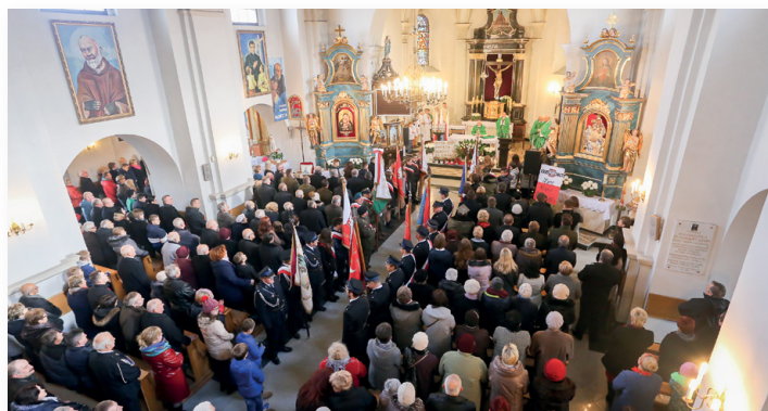
▲ Uroczystości zgromadziły wielu uczestników