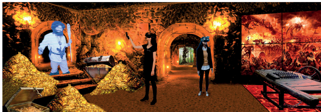
▲ Nowoczesne multimedia to mocna strona projektu

Zastosowane w kinie 5D efekty, to jednak nie jedyne multimedia zaplanowane w całym obiekcie. W parku zostaną zastosowane technologie wyświetlające doskonały obraz podłogowych paneli LED - owoch, hologramów, gier sterowanych myślą, mappingu, gier interaktywnych, paneli dotykowych, tapet 3D, okularów VR itp. Jednocześnie, aby nierealny świat uczynić jeszcze bardziej realnym, Park Dziedzictwa Gór Świętokrzyskich sięgnie także po techniki tradycyjne, stosowane w teatrze i filmie, a więc wysokiej jakości scenografię, budowaną po to, aby odtworzyć pomieszczenia legend, piwnice, jaskinie, zbrocza skalne, szczyty gór, brzegi rzek, itp. Tradycyjna baśniowa scenografia, połączona ze zdobyczami najnowocześniejszych technik, stosowanych w rozrywce, zagwarantuje widzowi pełne i kompletne doznania w zakresie poznawanych przez niego legend, ale też pochłanianej przez niego wiedzy.