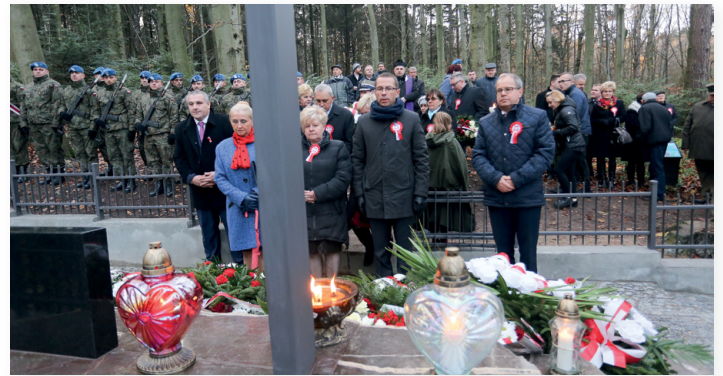
▲ Hołd poległym złożyła delegacja samorządu Gminy Nowa Słupia

O niepodległości, bohaterach, historii i współczesności mówili także parlamentarzyści i samorządowcy.