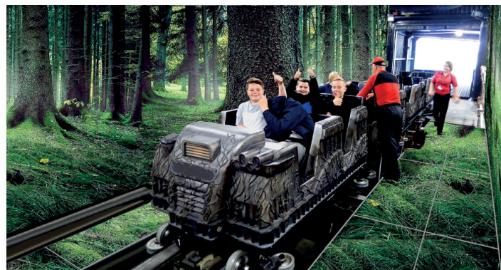
▲ Turyści zaczną zwiedzać Park od jazdy wagonikami

Założenie architektoniczne Parku opiera się na rozbudowie Centrum Kulturowo-Archeologicznego w formie okrągłego budynku przykrytego kopułą. W głównej centralnej sali pod kopułą znajduje się kino 5D, wokół którego poprowadzono ścieżkę edukacyjną. Przechodząc przez próg Parku, widz wsiada najpierw do wagoników kolejki, która przewozi go przez część budynku wprowadzając w rzeczywistość tajemnic, rzeczywistość puszczy jodłowej, świat niezrozumiały dla żyjących w nim wówczas ludzi, którzy wiele zjawisk musieli sobie tłumaczyć legendami i magią. Po opuszczeniu kolejki widz zaczyna spacerować przez przechodnie sale, w których będzie poznawał bohaterów kolejnych legend. Przekona się wówczas, jaki był powód tworzenia legend. W kilku salach ekspozycja zostanie podzielona na umowny panel A i panel B, w którym panel A będzie zawsze legendą, zaś panel B wytłumaczy legendę naukowo, pokaże morał lub prawdziwą historię, skonfrontowaną z legendą. Przemierzając kolejne sale, widz pozna historię