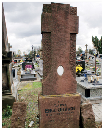
▲ 1 listopada zbieraliśmy datki na renowację pomnika Maryi Englichtówny

Towarzystwo Przyjaciół Nowej Słupi pragnie serdecznie podziękować wszystkim darczyńcom, którzy złożyli datkę do puszek w dniu 1 listopada 2017 r. na cmentarzu parafialnym w Nowej Słupi. Zebrane pieniądze w kwocie 1766,75 zł, 5 dolarów i 1 funt przeznaczone będą na renowację pomnika ludowej nauczycielki Maryi Englichtówny.