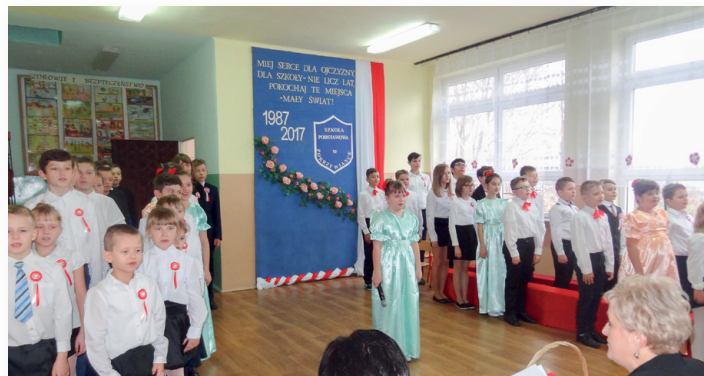
▲ Szkoła w Pokrzywiance obchodziła piękny Jubileusz

Podczas obchodów jubileuszów przypomniana została historia szkoły. Nie tylko o niej mówiono. Przygotowana została Galeria „starej fotografii”