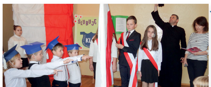
▲ A tak ślubowały dzieci w Paprocicach