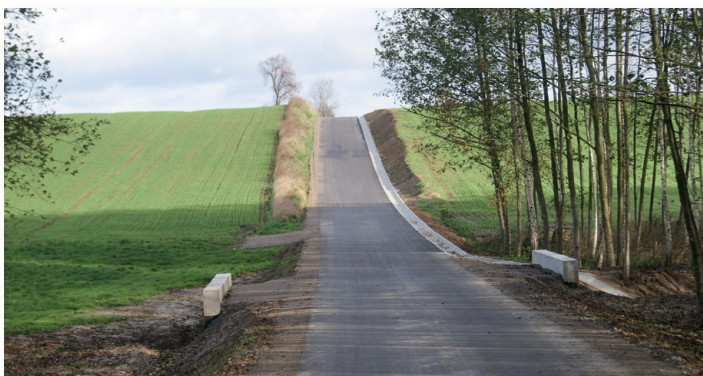
▲ Wyremontowany odcinek drogi w Jeziorku o dł. 715 mb