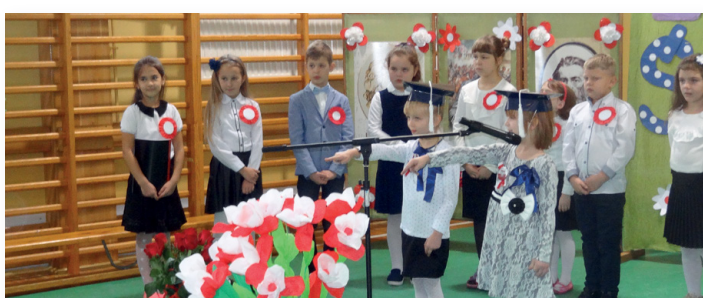
▲ Ślubowanie w SP w Jeziorku również wypadło okazale