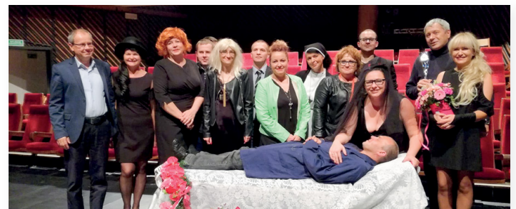
▲ Spektakl na scenie KCK w Kielcach wzbudził aplaus publiczności

- Mamy także zaproszenie do Skarżyska-Kamiennej, a nawet w Bieszczady -