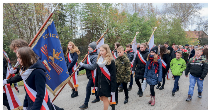
▲ Barwnie prezentował się korwów pocztów sztandarowych