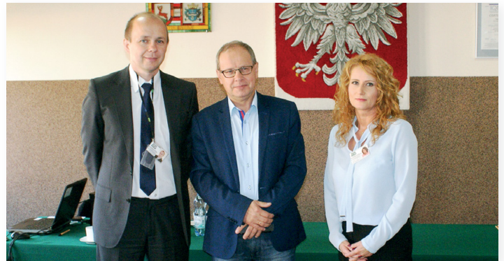
Pracownicy ZUS w Kielcach doradzali w sprawach emerytalnych mieszkańcom gminy

„Po pierwsze klient” - pod takim hasłem zainicjował jako pierwszy w powiecie kieleckim punkt konsultacyjny doradców Zakładu Ubezpieczeń Społecznych w gminie Nowa Słupia. Choć to akcja jednorazowa, to od razu zyskała dużą popularność wśród mieszkańców naszej gminy