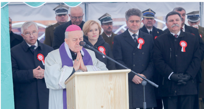
▲ Za Ojczyznę i poległych na Skałce w Nowej Słupi modlił się ks. biskup Edward Frankowski

Obchody 99. rocznicy odzyskania przez Polskę niepodległości połączono w Nowej Słupi z poświęceniem odnowionego pomnika na Skałce, który upamiętnia ofiary II wojny światowej zamordowane przez okupanta niemieckiego w latach 1939-1945. Patronat nad uroczystościami objął Prezydent Rzeczypospolitej Polskiej Andrzej Duda.