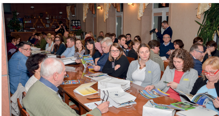
▲ Konferencja zgromadziła wiele biur podróży z całej Polski

Konferencja Turystyczna wraz z wizytą studyjną została dofinansowana w ramach grantu przez Lokalną Grupę Działania Stowarzyszenie Rozwoju Wsi Świętokrzyskiej.