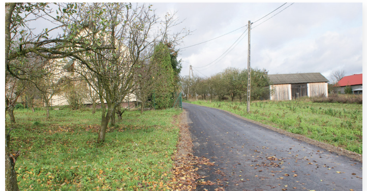
▲ Wyremontowana droga w Dębniaku

Roboty zostały zakończone w dniu w październiku 2017 r.