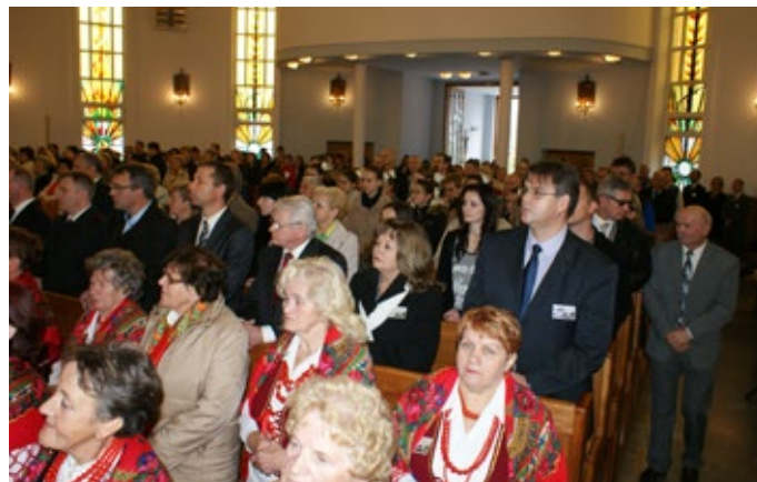
Obchody 50-lecia rozpoczęły się od mszy świętej.