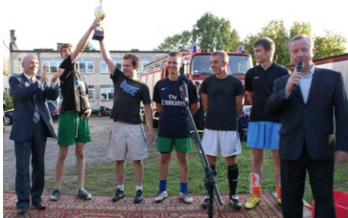
Drużyna ze Starej Słupi z okazałym pucharem.