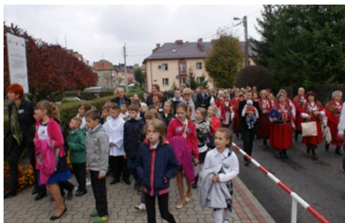
Spółeczność Rudek tłumnie uczestniczyła w obchodach.