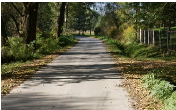
Budowa drogi Baszowice przez wieś.