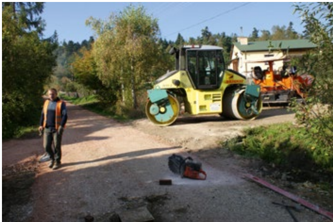
Budowa nowej drogi w Nowej Słupi, ul. Łazy.