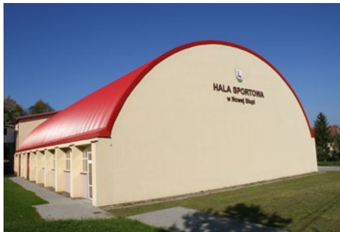
Hala sportowa w Nowej Słupii.

Przy dużej determinacji wójta kierowany przez niego Urząd Gminy w Nowej Słupii otrzymał w 2013 roku certyfiakat zarządzania jakością ISO 9001:2008 . Dołączając w ten sposób do ścisłego grona kilku samorządów w regionie świętokrzyskim, które ten system zarządzania posiadają. Pokreślenia wymaga fakt, iż certyfiakat został uzyskany dzięki współpracy ze Związkiem Powiatów Polskich z wykorzystaniem znacznych środków z Unii Europejskiej.