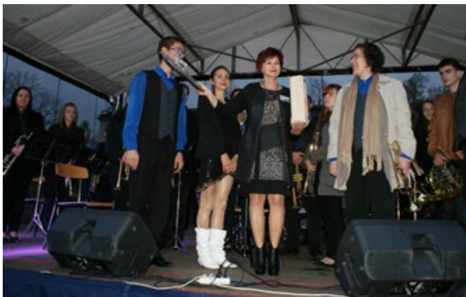
Dyrektor szkoły w Rudkach podziękowała za organizację jubileuszu.