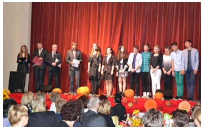
Stypendia dla najzdolniejszej młodzieży z gminy rozdane.