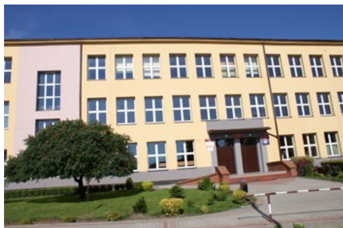
Remont Zespołu Szkół w Rudkach.