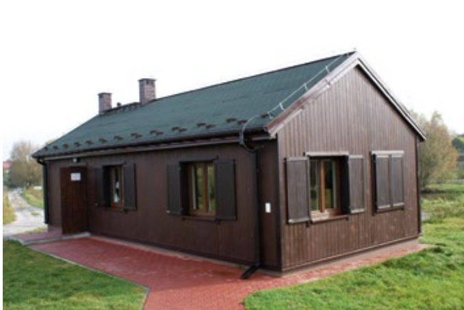
Budowa świątelnicy w Baszowicach.