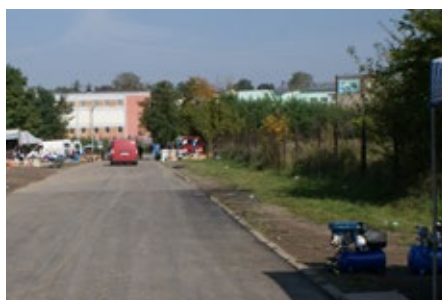
Przebudowa drogi w Rudkach, ul. 22 Lipca.