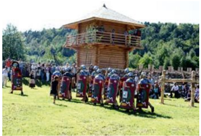
Centrum Kulturowo-Archeologiczne w Nowej Słupi.

Gmina Nowa Słupia to kolebka historii, kultury i turystyki w regionie świętokrzyskim. Wykonano „ Rekompozycję Drogi Krzyżowej z Nowej Słupi na Święty Krzyż ” z 14 stacjami drogi krzyżowej jako ważny element tożsamości kulturowej i narodowej regionu. Warto przypomnieć, że do sztandarowych inwestycji w zachowanie dziedzictwa kulturowego należy niewątpliwie budowa Centrum Kulturowo-Archeologicznego w Nowej Słupi , które jest jedynym tego typu obiektem w Europie, gdzie prezentowana jest problematyka starożytnej metalurgii żelaza w jej szerokim kontekście kulturowym. Wyremontowano zaniedbany i poddany całkowitej ruinie Gminny Ośrodek Kultury w Rudkach . Dziś jest wizytówką na cały region.