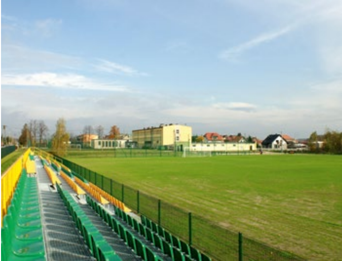
Budowa stadionu w Rudkach.