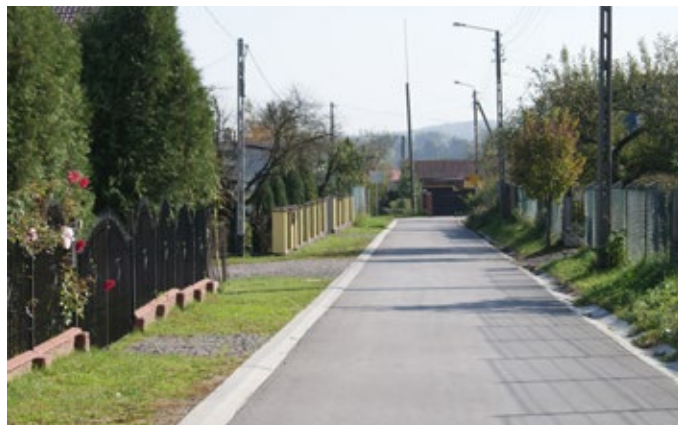
Budowa drogi Rudki, ul. Krótka.