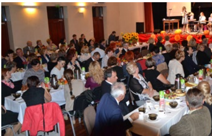
Do GOK przybyło wielu obecnych i emerytowanych nauczycieli.

Całą uroczystość umilił występ Amatorskiego Teatru „Święty spokój” działającego przy Gminnym Ośrodku Kultury w Rudkach oraz Kabaretu Czwarta Fala. Dla wszystkich gości przygotowano również poczęstunek.