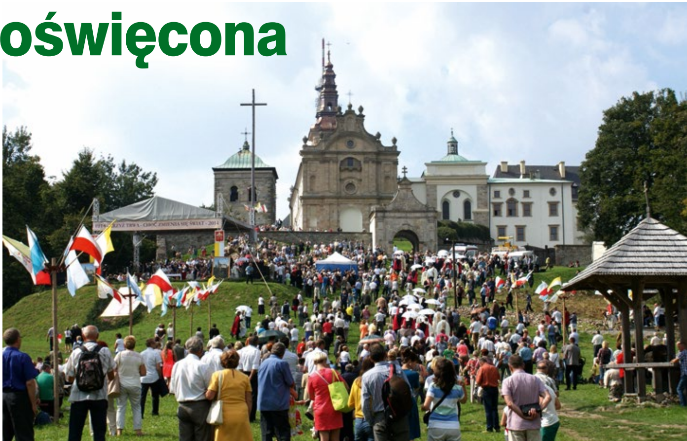
Tłum wiernych zgromadził się na Świętym Krzyżu, by uczestniczyć w uroczystości poświęcenia wieży klasztornej.