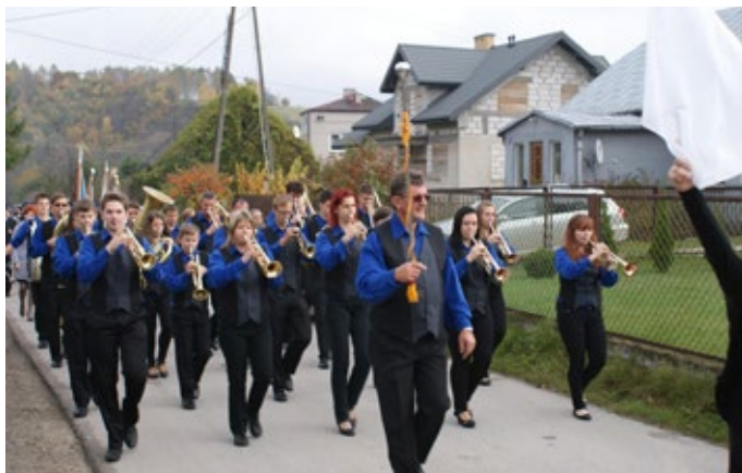
Jubileusz uświetniła orkiestra z Węgier.