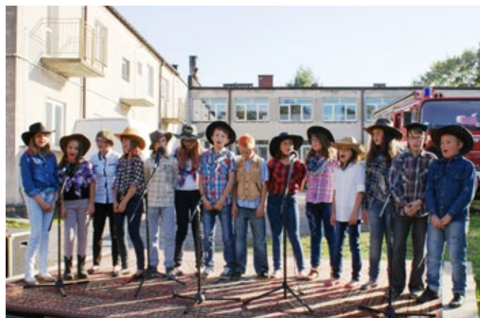
Organizatorzy dla wszystkich uczestników imprezy, bez względu na wiek, przygotowali moc atrakcji.