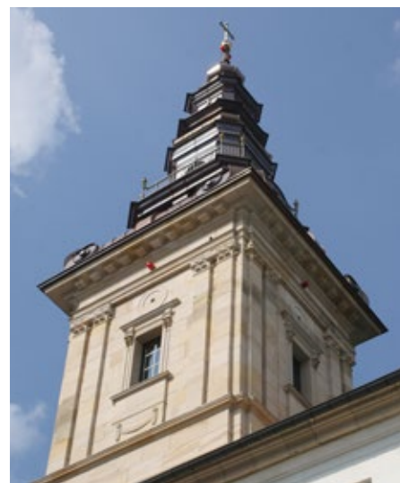
Wieża na Świętym Krzyżu.

Nie zachowała się żadna dokumentacja barokowej wieży, jej zarys odtworzono z rycin i fotografii. Pierwszy etap polegał na nadbudowaniu na kościele trzydziestometrowej konstrukcji i został zakończony już w marcu. Po montażu najbardziej skomplikowanych części, które musiały być wykonane zgodnie z dawną sztuką zdobniczą, wieża ma 52 metry, z czego stalowo-drewniany hełm wieży pokryty miedzianą blachą - 7 metrów.