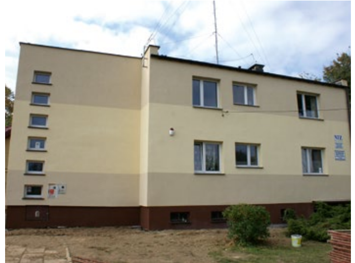
Remont Ośrodka Zdrowia w Nowej Słupi.