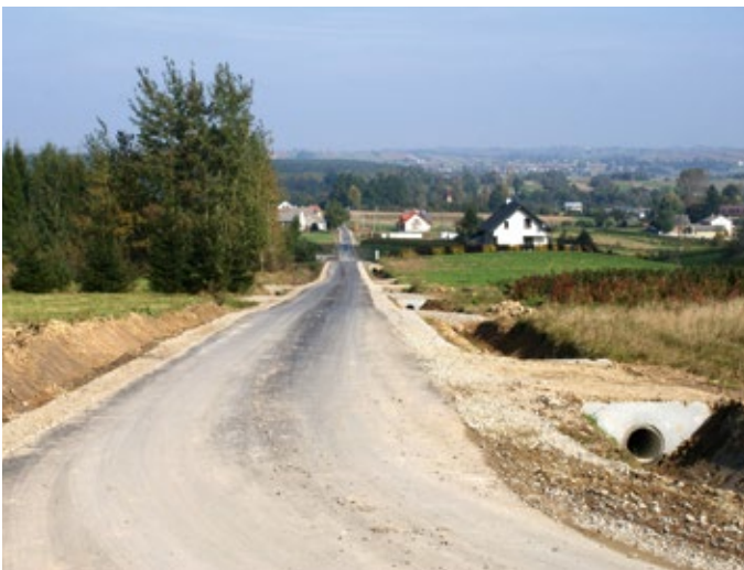
Budowa nowej drogi – Dębno Parcele.