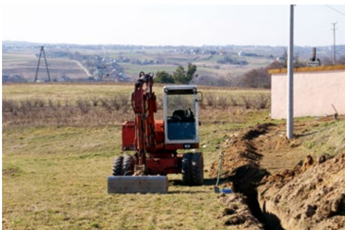
Budowa wodociągów w Skalach, Włochach, Starej Słupi (Podchełmie), Wólce Milanowskiej, Jeleniowie.