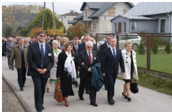
W uroczystościach uczestniczyła delegacja z Csegele.