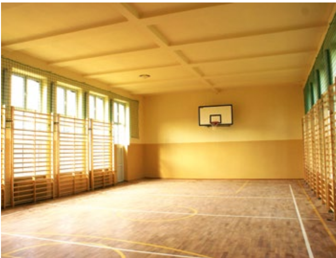
Remont generalny sali gimnastycznej w Rudkach.