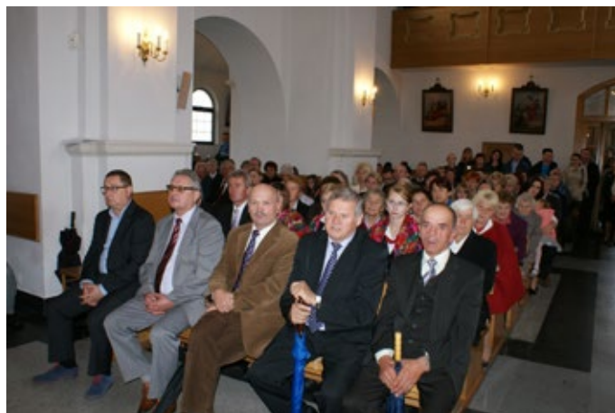
W uroczystościach wzięło wielu mieszkańców całej gminy.