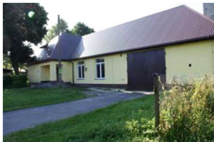
Remont remizy OSP w Starej Słupi.