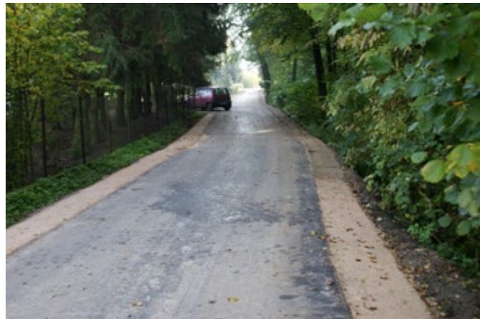
Budowa drogi w Starej Słupi – „ślepa kiszka”.