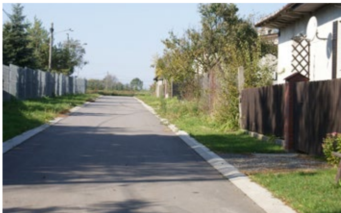
Budowa drogi Rudki, ul. Graniczna.