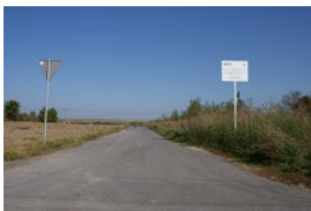
Budowa drogi Rudki, os. Górne-Łąki.