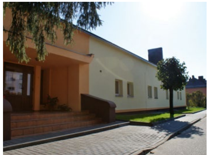
Remont przedszkola w Rudkach.