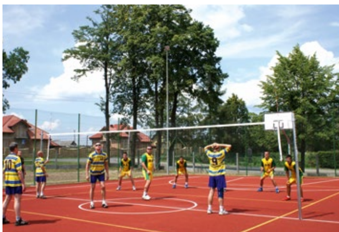
Kompleks boisk w Rudkach – „Orlik”.

Gmina Nowa Słupia to jeden z samorządów w województwie świętokrzyskim najlepiej wykorzystujących środki z Unii Europejskiej. W latach 2007-2014 gmina Nowa Słupia zainwestowała w kluczowe inwestycje ponad 52 mln złotych. Wartość projektów z dofinansowaniem Unii Europejskiej, rządu norweskiego, Banku Światowego, budżetu państwa i powiatu kieleckiego wyniosła 48 mln złotych, z czego otrzymano dofinansowanie w kwocie ponad 27 mln zł. A wskaźnik projektów z dofinansowaniem wyniósł 57%, co jest doskonałym wynikiem ukazującym bardzo duże zaangażowanie gminy w pozyskiwanie środków zewnętrznych