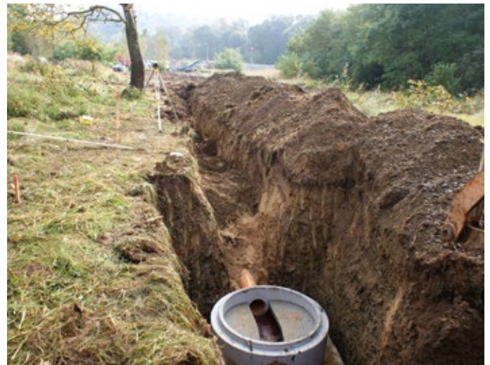
Budowa kanalizacji w Sosnowce.