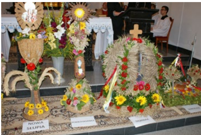
Każdy z wieńców dożynkowych to prawdziwe dzieło sztuki.

Wieńce wykonały sołectwa: Nowa Słupia, Baszowice, Hucisko, Mirocice, Jezioro