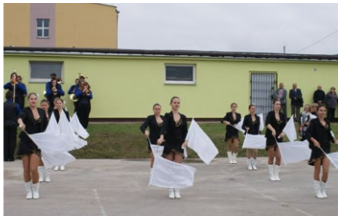
Prawdziwą ozdobą pokazów był występ mażorettek.