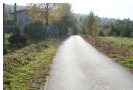
Budowa drogi w Jeleniowie.