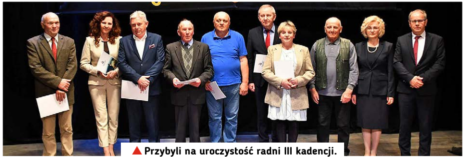
▲ Przybyli na uroczystość radni III kadencji.

Uroczystości uświetnił koncert muzyki klasycznej.