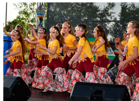
▲ Występy taneczne najmłodszych.

pokaz tresury oraz omówił podstawowe zasady zachowania wobec psów. Dzieci miały także możliwość pogłaskać policyjnego czworonoga.