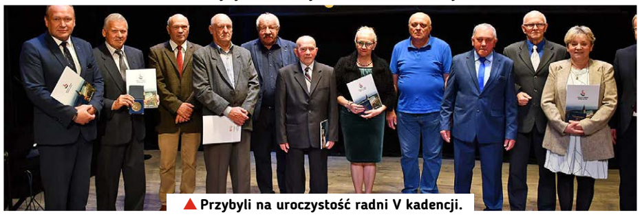
▲ Przybyli na uroczystość radni V kadencji.