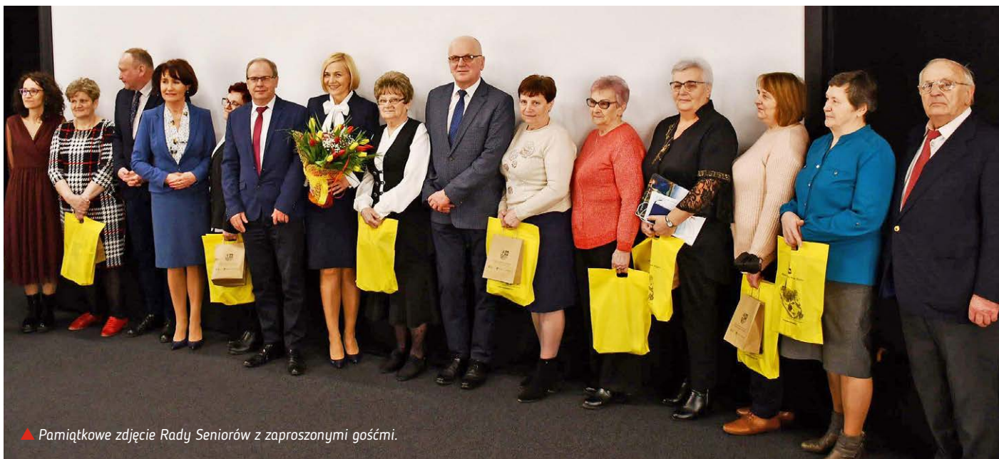
▲ Pamiątkowe zdjęcie Rady Seniorów z zaproszonymi gośćmi.

Dziewięcioosobowa Rada Seniorów Gminy Nowa Słupia zainaugurowała działalność. W piątek, 18 lutego, odbyło się pierwsze posiedzenie, podczas którego członkowie rady wybrali przewodniczącego i wiceprzewodniczącego. Posiedzenie odbyło się w siedzibie Muzeum Starożytnego Hutnictwa Świętokrzyskiego w Nowej Słupi.