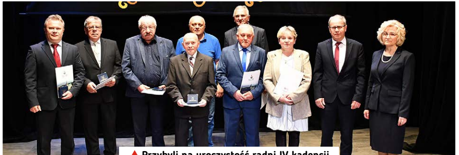
▲ Przybyli na uroczystość radni IV kadencji.