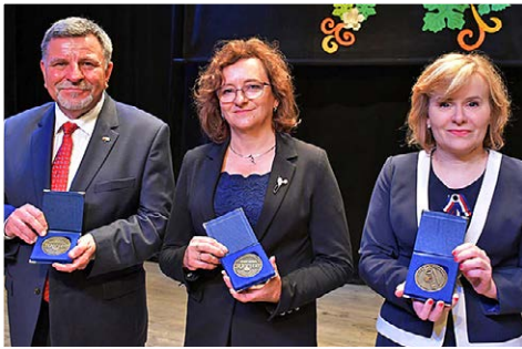
▲ Za wspieranie gminy w przemianach społeczno-gospodarczych medale otrzymali posłowie na Sejm RP, od lewej: Andrzej Kryj, Agata Wojtyszek oraz Anna Krupka.