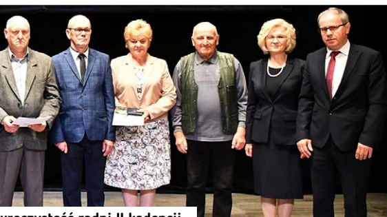
▲ Przybyli na uroczystość radni II kadencji.