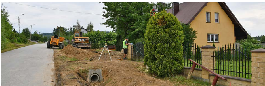
▲ Trwa budowa kanalizacji w Bartoszowinach.