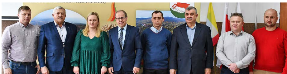
▲ W kwietniu podpisano długo oczekiwaną umowę.

- Cieszę się, że przy obecnym wzroście cen materiałów i robót budowlanych udało nam się dodatkowo pozyskać dofinansowanie w ramach rządowego programu Fundusz Inwestycji Strategicznych na tą inwestycję - przyznaje burmistrz Andrzej Gąsior. Dzięki pozyskanej dotacji mogliśmy ogłosić przetarg, wyłonić wykonawcę zadania. Już za rok mieszkańcom Bartoszowin będzie żyło się dużo bardziej komfortowo - zapowiada burmistrz