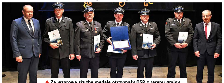
▲ Za wzorową służbę medale otrzymały OSP z terenu gminy.