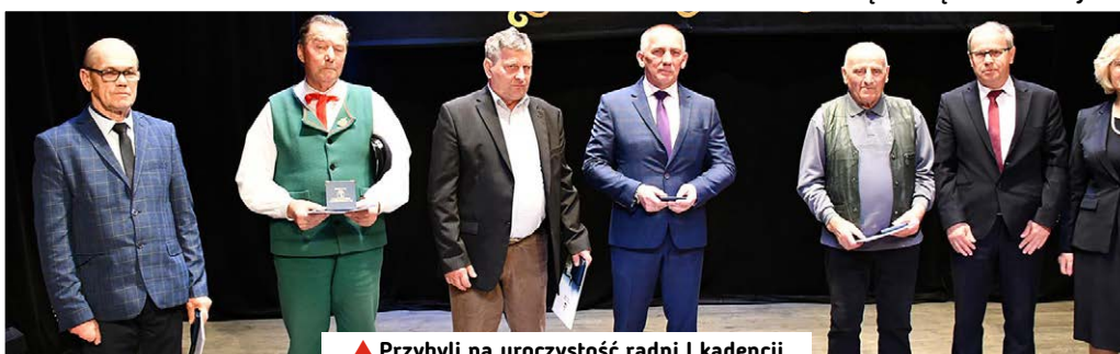
▲ Przybyli na uroczystość radni I kadencji.