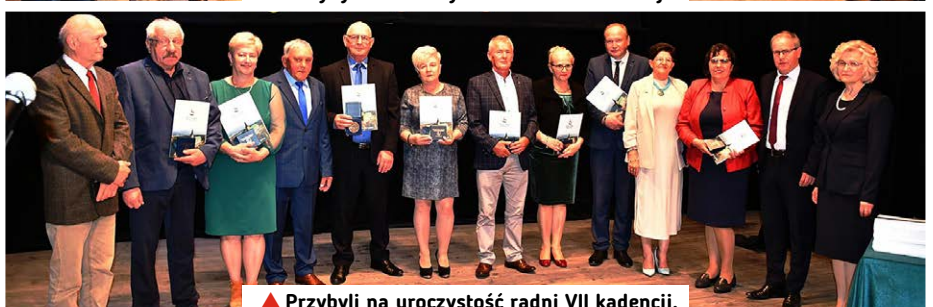
▲ Przybyli na uroczystość radni VII kadencji.