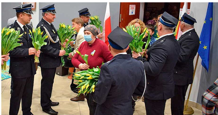
▲ Każda Pani od druhow z OSP otrzymała żółtego tulipana.