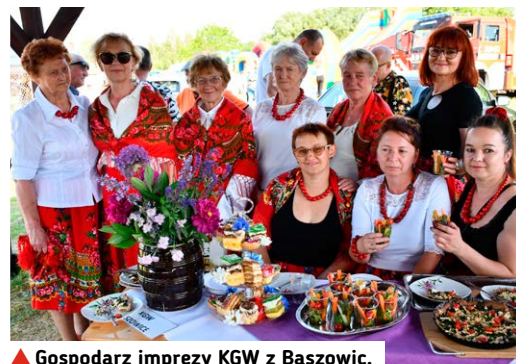
▲ Gospodarz imprezy KGW z Baszowic.