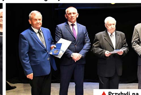
▲ Przybyli na