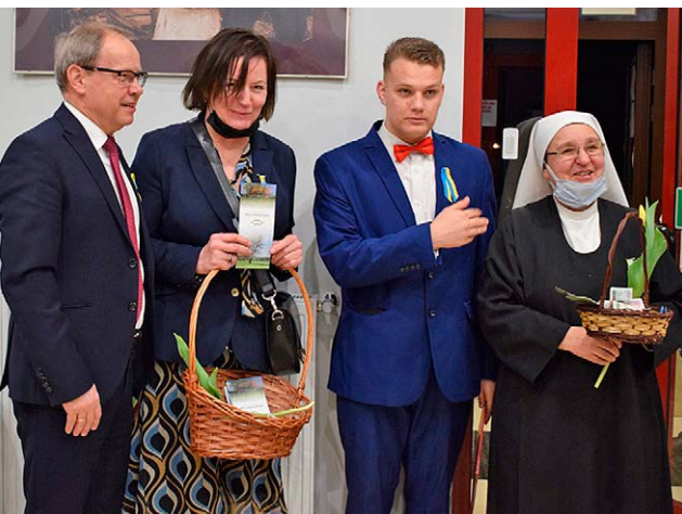
▲ Podczas koncertu zbierano datki na rzecz Ukrainy.

Organizatorzy pragną serdecznie podziękować wszystkim Gościom za przybycie oraz hojne wsparcie działań pomocowych na rzecz Ukrainy, prowadzonych przez Fundację Opcja Benedykta, która po wydarzeniu zbierała na ten cel datki.