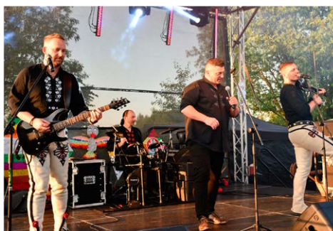
▲ Gwiazda wieczoru zespół Zbóje.