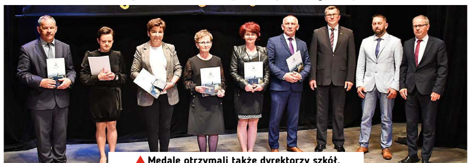
▲ Medale otrzymali także dyrektorzy szkół.