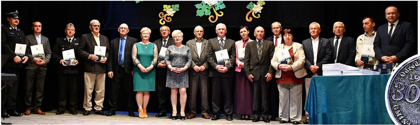
▲ Urzędujący sołtysi.

Niezwykle uroczysty charakter miały obchody Dnia Samorządowca w Gminie Nowa Słupia połączone z wręczeniem medali z okazji 30. rocznicy odrodzonego Samorządu.