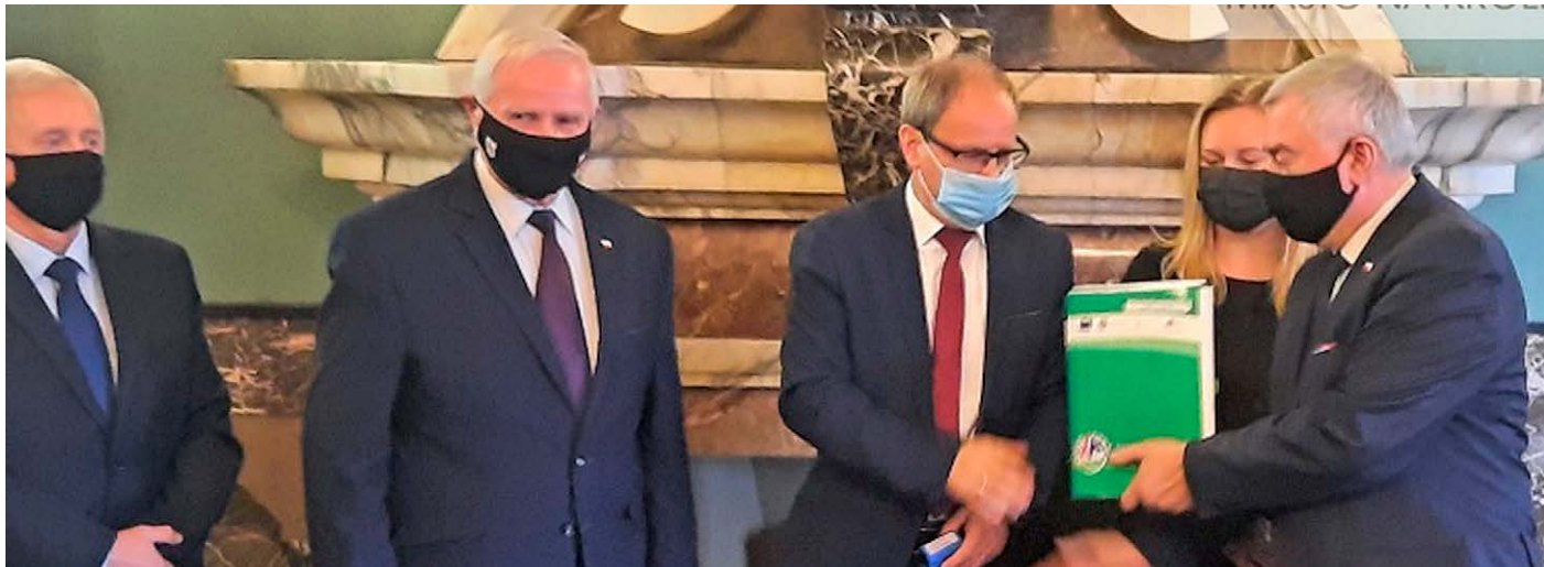
▲ Marszałek województwa świętokrzyskiego przekazuje podpisaną umowę na dofinansowanie budowy świetlicy w Dębnie.

W maju br. gmina Nowa Słupia pozyskała dodatkowe środki finansowe na budowę świetlicy w Dębnie z Rządowego Programu Inwestycji Strategicznych, co przy obecnym wzroście cen materiałów i robót budowlanych stwarza realną szansę na przeprowadzenie tej inwestycji.