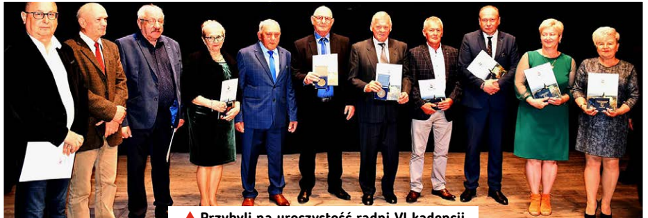
▲ Przybyli na uroczystość radni VI kadencji.