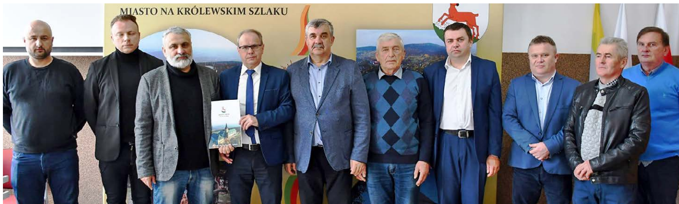
▲ Tuż po podpisaniu umowy. To ważna inwestycja dla mieszkańców Jeziorka, Dębna oraz ul.Chełmowej w Nowej Słupi.

Wszystko wskazuje na to, że już za kilkanaście miesięcy mieszkańcy Jeziorka, Dębna i Nowej Słupi (ul. Chełmowa) będą mogli podłączyć się do gminnej sieci kanalizacyjnej.