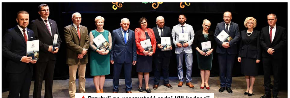
▲ Przybyli na uroczystość radni VIII kadencji.