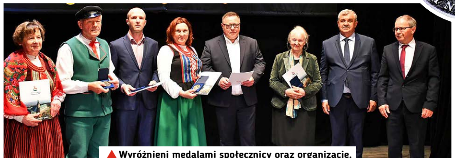
▲ Wyróżnieni medalami społecznicy oraz organizacje.

Doniosłą chwilą uroczystości było uczczenie pamięci zmarłych samorządowców z Gminy Nowa Słupia „minutą ciszy”.